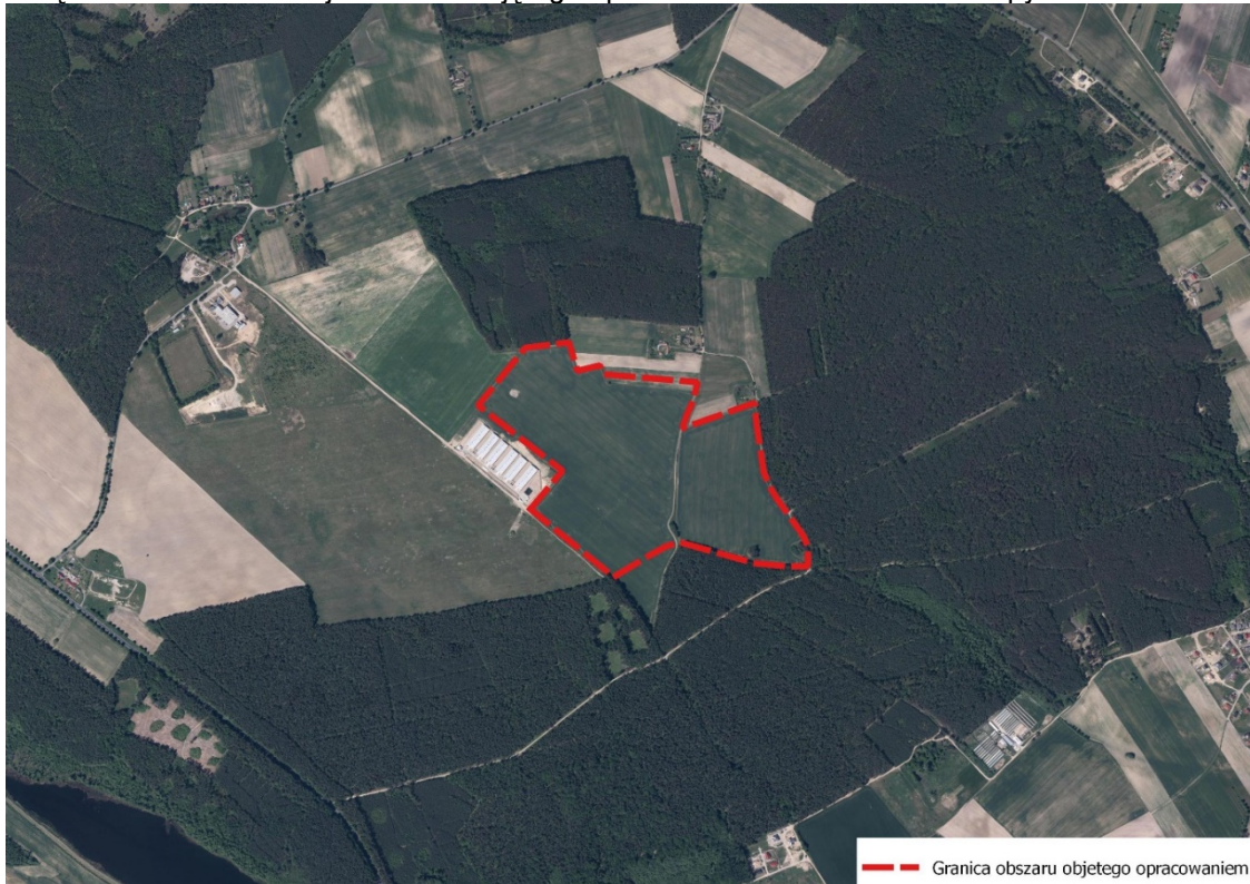
Załącznik nr 1. Lokalizacja obszaru objętego opracowaniem na tle ortofotomapy